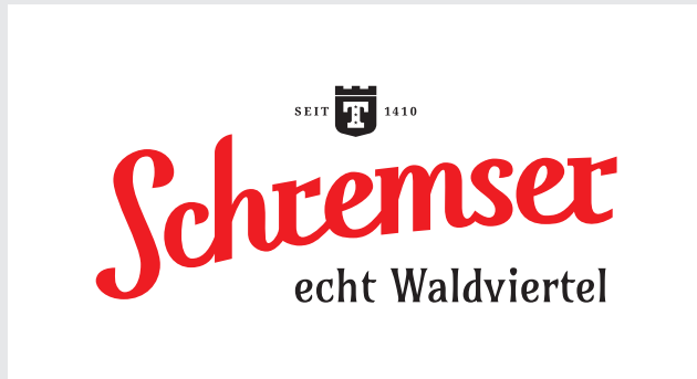
Primary Logo färbig