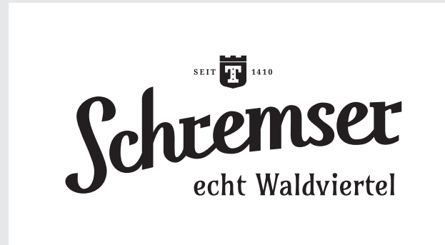
Primary Logo einfärbig